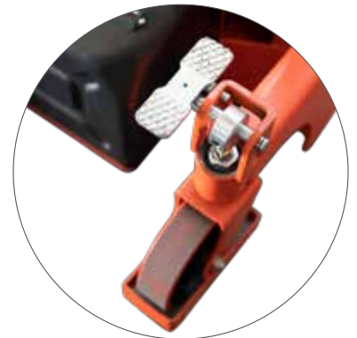
Lenkrollen mit Feststellbremse