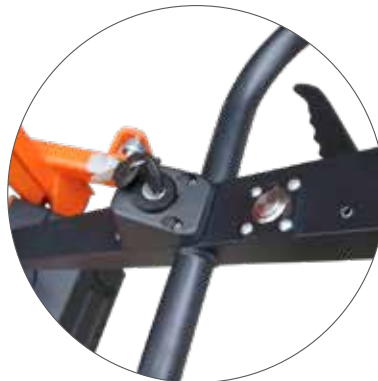
Deichsel mit Schlüsselschalter und Signaltaste