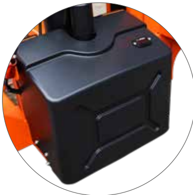
Batterie mit Ladestandanzeige