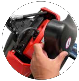
leichte Akku Entnahme