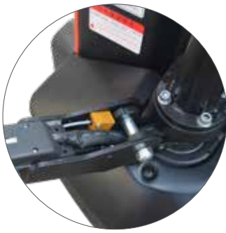
Sensor zur Fahrfreigabe