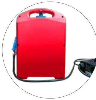
kompakter Lithium Ionen Akku