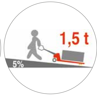
5% Steigfähigkeit bei Volllast