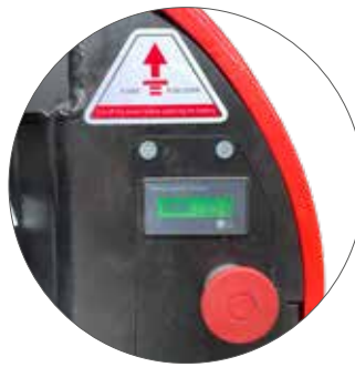
Batterieladestand- und Betriebsstundenanzeige mit Not-Aus-Knopf