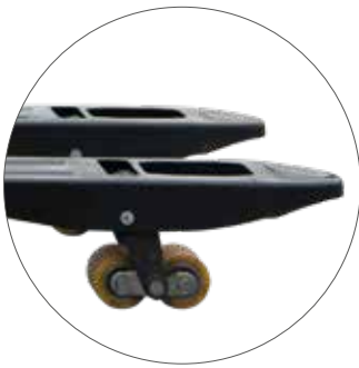
Tandem PU Gabelrollen