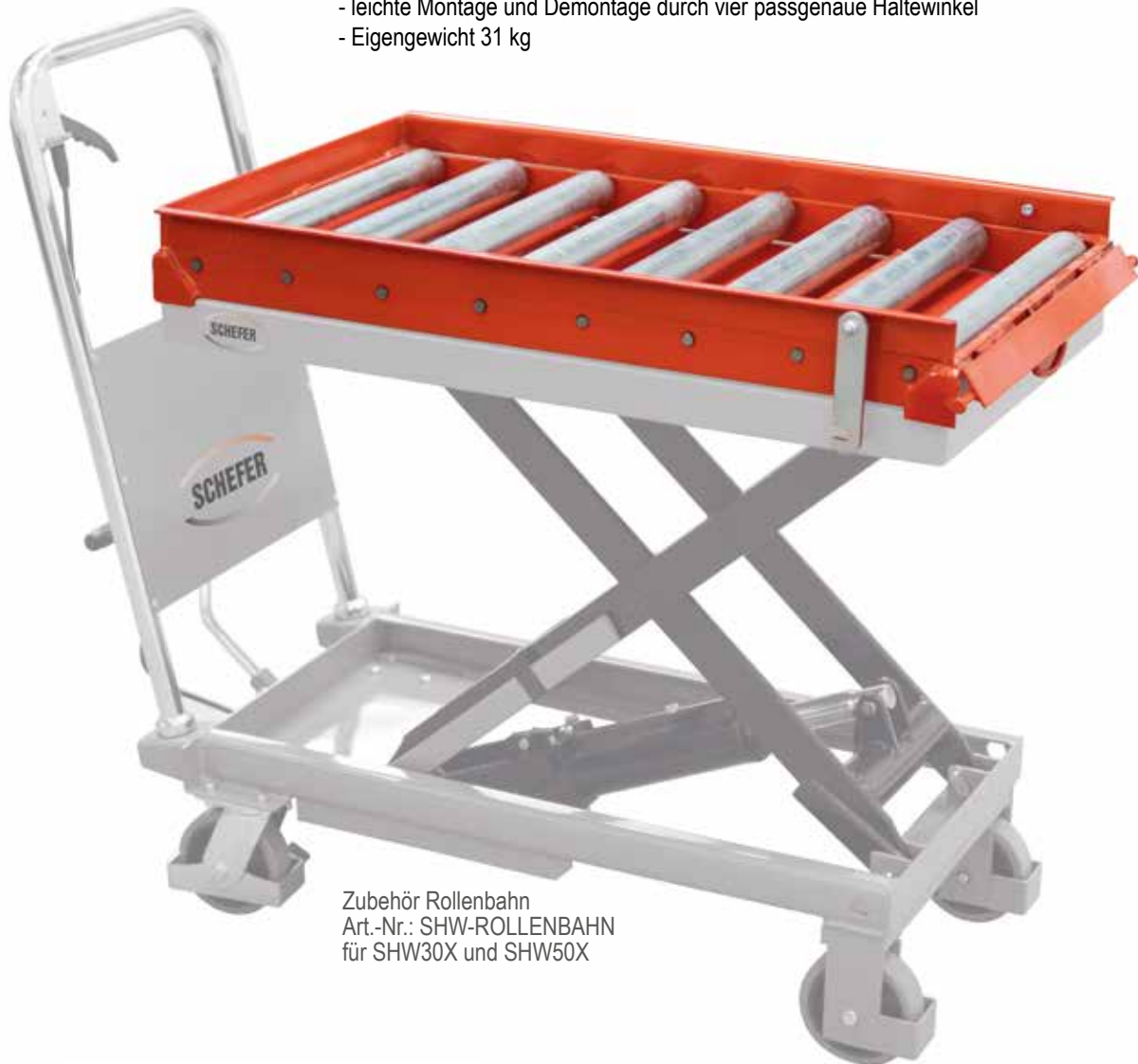
Zubehör Rollenbahn Art.-Nr.: SHW-ROLLENBAHN für SHW30X und SHW50X