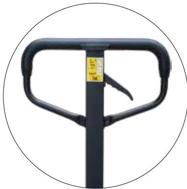
Stabile Deichsel mit Gummi-Kunststoffummantelung