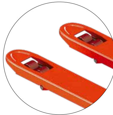
Ein- und Ausfuhrrollen