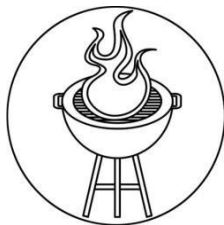
Auf einem Grill