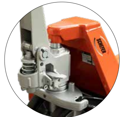
Hochleistungs-Hydraulikpumpe mit Zentralverschluss