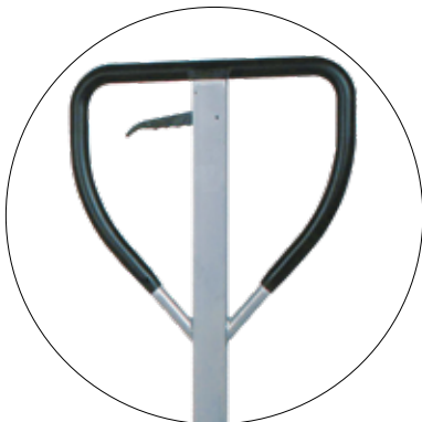
Original Schefer Deichsel mit Gummi-Kunststoffummantelung