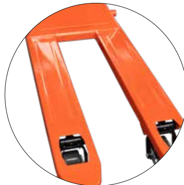
Längsvertiefungen zur Versteifung