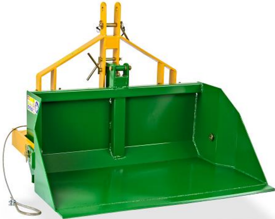
Abbildung zeigt ArtNr. 52573

LESEN SIE DIE BEDIENUNGSANLEITUNG UND DIE SICHERHEITSHINWEISE VOR DER ERSTEN VERWENDUNG GRÜNDLICH DURCH!